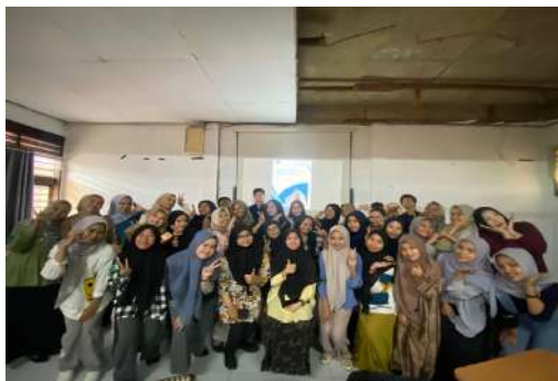
Gambar 3. Peserta Pealtihan Pose Bersama Setelah Paparan Materi

Sebagai bentuk dokumentasi dan apresiasi terhadap antusiasme mahasiswa dalam mengikuti kegiatan edukasi penulisan book chapter , berikut ditampilkan momen kebersamaan peserta pelatihan setelah sesi paparan materi berakhir.