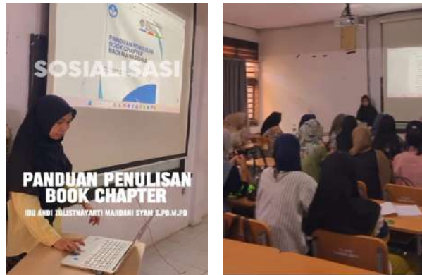
Gambar 2. Pemaparan Materi Teknis Penulisan Book Chapter

Menampilkan sesi penyampaian materi yang mengulas langkah-langkah teknis dalam menulis book chapter secara ilmiah. Dalam kesempatan ini, mahasiswa dibekali pemahaman mengenai penyusunan struktur tulisan yang tepat, strategi mengembangkan gagasan utama dalam sebuah bab, serta cara mengaitkan isi tulisan dengan tema keseluruhan buku. Narasumber juga membagikan contoh book chapter terpublikasi sebagai referensi, guna memudahkan peserta memahami penerapan teori ke dalam praktik. Tujuan utama dari sesi ini adalah membangun kompetensi mahasiswa dalam menulis book chapter yang terstandar dan siap untuk dipublikasikan.