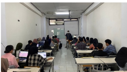
Gambar 2. Proses Pelatihan ruang kelas 1.

Tahapan berikutnya adalah praktik langsung pembuatan website, yang menjadi inti dari pelatihan ini. Peserta diarahkan untuk membuat website sederhana yang berfungsi sebagai media pemasaran produk Tata Boga mereka. Praktik dimulai dengan pendaftaran akun WordPress, diikuti dengan pemilihan template, pengaturan halaman utama, dan penambahan konten seperti foto produk, deskripsi usaha, dan kontak. Setiap langkah dipandu oleh fasilitator yang secara aktif membantu peserta menyelesaikan kendala teknis. Suasana interaktif terlihat selama sesi praktik, di mana peserta berdiskusi dan saling membantu dalam menentukan desain website yang sesuai dengan karakteristik usaha mereka.