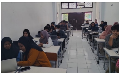
Gambar 3. Proses Pelatihan ruang kelas 2.