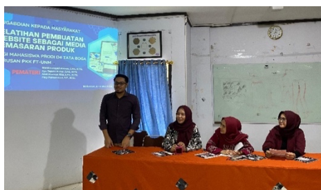
Gambar 1. Sesi Pembukaan di laboratorium PKK FT UNM

Sebelum pelatihan dimulai, mayoritas mahasiswa peserta memiliki keterbatasan dalam memahami konsep pemasaran digital, terutama terkait penggunaan website sebagai media pemasaran. Berdasarkan survei awal yang dilakukan oleh tim pengabdian, sekitar 85% dari total 50 peserta menyatakan bahwa mereka belum pernah menggunakan platform pembuatan website, seperti WordPress. Sebagian besar mahasiswa hanya mengandalkan media sosial seperti Instagram atau WhatsApp untuk mempromosikan produk mereka. Keterbatasan ini menunjukkan perlunya pelatihan yang tidak hanya memperkenalkan teknologi baru tetapi juga memberikan keterampilan praktis yang relevan dengan kebutuhan mahasiswa di bidang Tata Boga.