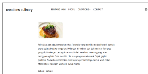
Gambar 5. Hasil Pelatihan.